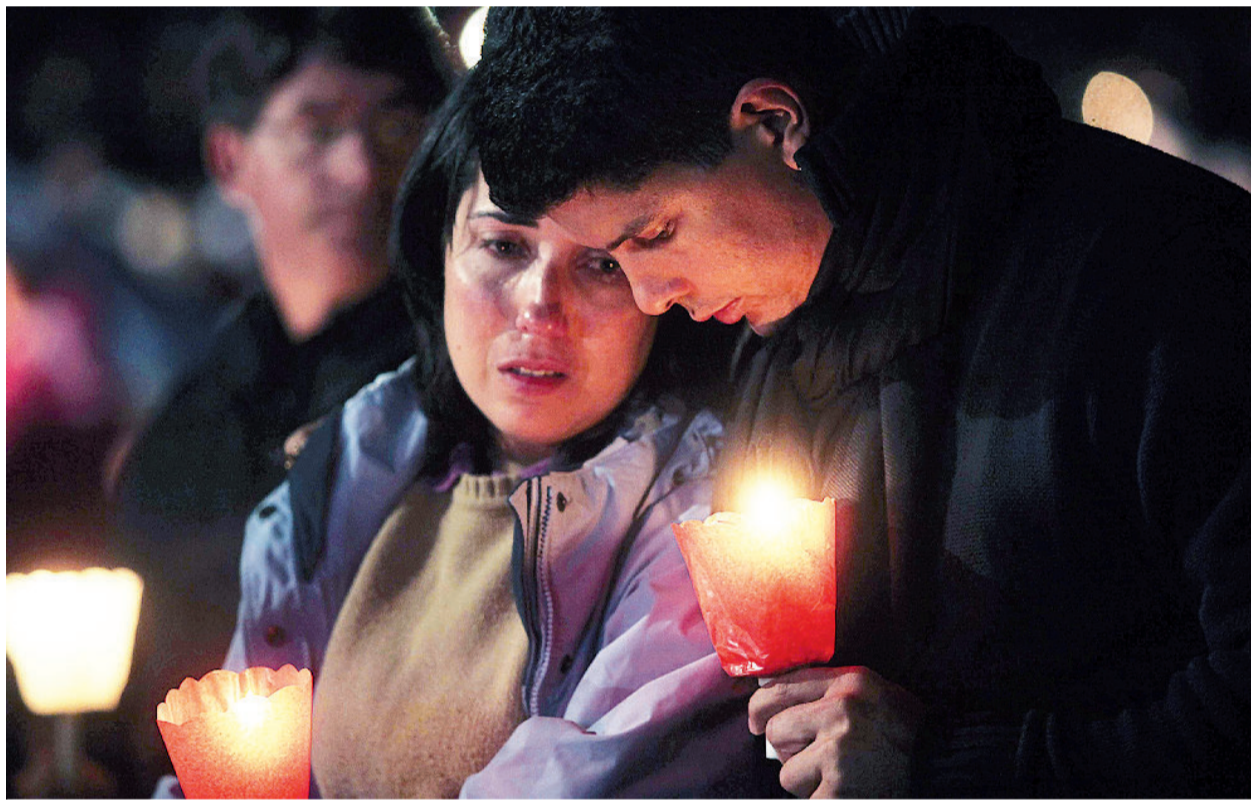
Giovani in preghiera. Sotto, il timbro che verrà apposto sulle «credenziali» dei pellegrini

Gli universitari si ritroveranno, con la Fuci, nella Rettoria Gesù e Maria, men-