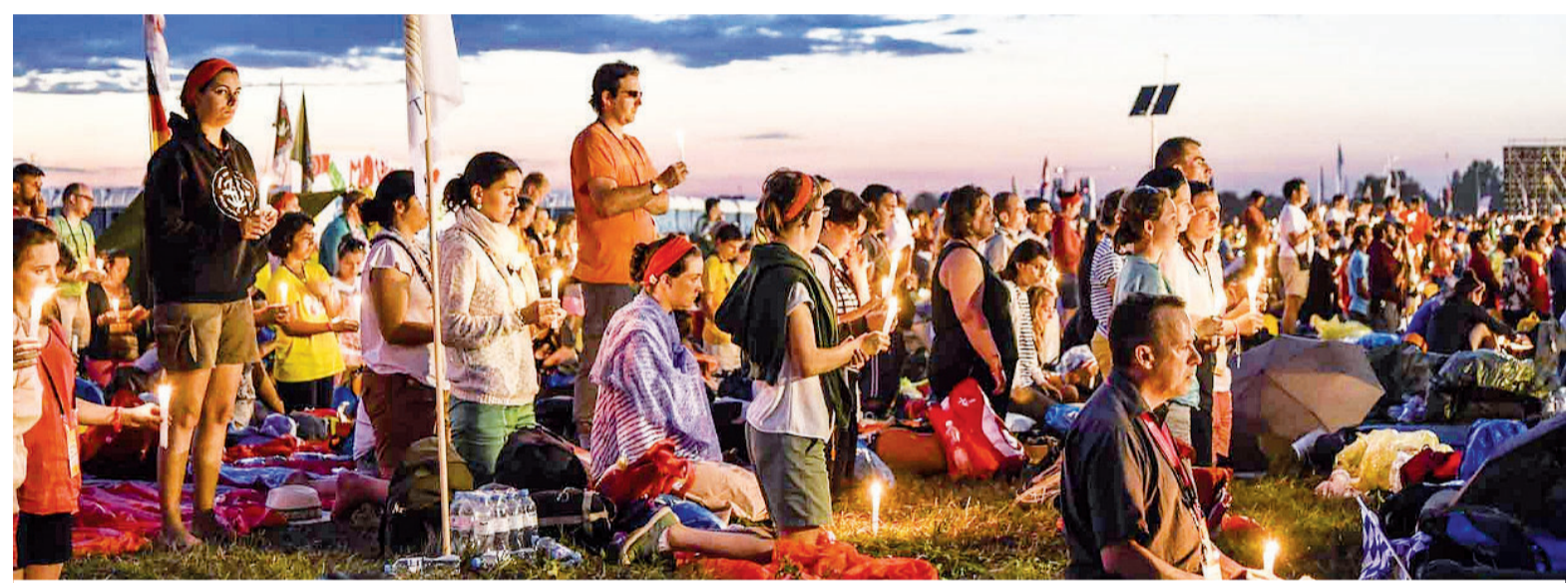
La veglia a Campus Misericordiae durante la Gmg di Cracovia 2016

D ue momenti forti con papa Francesco, una notte bianca per le chiese della Città eterna, preghiera, festa, un nuovo inno da cantare. Ecco gli ingredienti principali dell'incontro dei giovani italiani con Bergoglio, in programma a Roma l'11 e il 12 agosto: circa 24 ore, a cavallo tra due giorni, da vivere all'insegna dell'ascolto e della condivisione, in preparazione al Sinodo di ottobre. Sabato, a partire dalle 13, i ragazzi confluiranno al Circo Massimo dove alle 16,30 saranno accolti dalla band «The Sun». Alle 18,30 arriverà il papa e alle 19 inizierà la veglia di preghiera. Dopo cena, la serata continuerà con la musica e la festa, mentre a mezzanotte prenderà il via la notte bianca: le chiese resteranno aperte per la riflessione, l'adorazione, le confessioni. Domenica mattina tutti a piazza san Pietro per la messa che Francesco celebrerà alle 9,30 e per la recita dell'Angelus che concluderà l'evento.