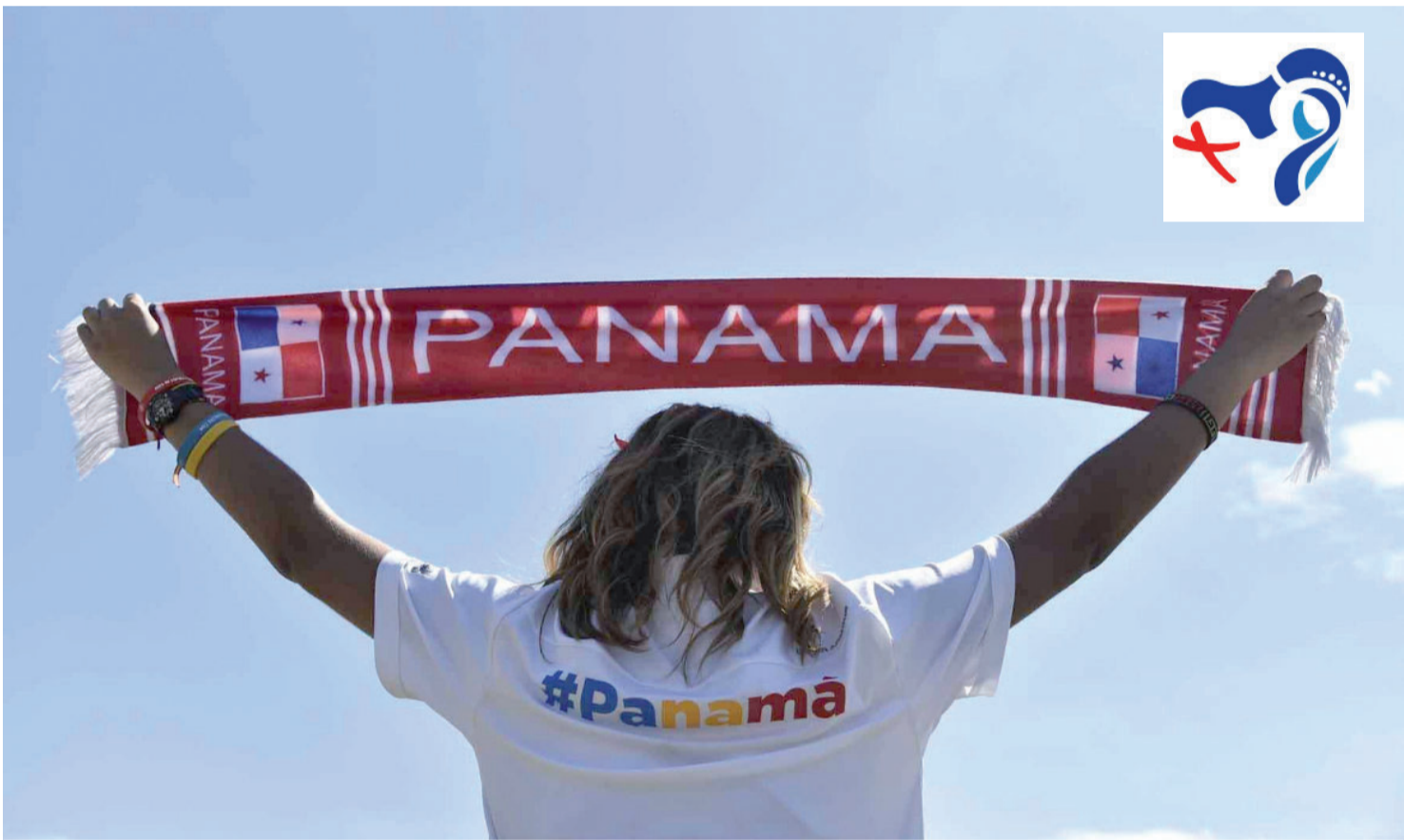
Uno scatto realizzato durante la Gmg di Cracovia, dopo l'annuncio di Panama 2019. In alto, il logo

anche avviata la trattativa con i ristoranti per i pasti ed è stata pubblicata la catechesi preparatoria. Infine, sottolinea Chang Gonzales, «sono iniziate le prove per il coro e l'orchestra, più di 300 persone, e abbiamo firmato il contratto per i paramenti liturgici dei vescovi e dei sacerdoti. La verità è che stiamo lavorando intensamente, perché tutto sia pronto a tempo debito e nel migliore dei modi». Un altro snodo fondamentale del cammino di preparazione sarà l'Incontro preparatorio in programma dal 6 al 10 giugno prossimo. «Questo appuntamento - affermano gli organizzatori - ci consentirà uno scambio di vedute con le delegazioni di pastorale giovanile di tutto il mondo, in modo da presentar loro come ci stiamo preparando». Infine sono state definite anche le grandi linee dei gemellaggi pre-Gmg («i giovani oltre che a Panama saranno ospitati dalle diocesi di Costa Rica e Nicaragua»), delle catechesi («saranno allocate nelle 100 parrocchie di Panama, nelle palestre e nelle sale riunioni delle scuole») e dell'ospitalità («i ragazzi alloggeranno nelle famiglie e in scuole pubbliche e private»).