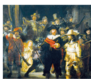
Rembrandt, Ronda di notte

sostenere; le relazioni con il territorio che crescono e offerte di un po' di biscotti non è la furbata di chi ottiene le cose senza pagare, ma la sorpresa di chi ha ricevuto solidarietà e ha barattato un po' di cibo con una preghiera durante il pellegrinaggio; i giovani che finalmente si accorgono dell'inutile stipato nelle loro case e sono costretti a scegliere l'indispensabile - operazione quanto mai difficile e già di per sé educativa. Siamo alla vigilia di un grande momento di Chiesa: il Sinodo plasticamente rappresentato da giovani che camminano in un gesto di comunità accompagnati da cristiani adulti (laici e preti) che non intendono sottrarsi alla domanda su cosa possa signifi-