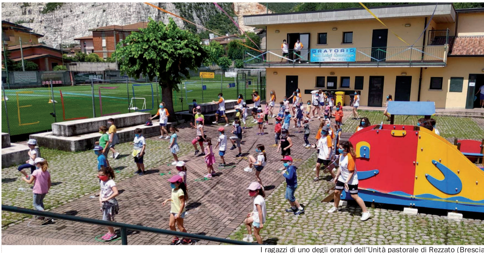
I ragazzi di uno degli oratori dell'Unità pastorale di Rezzato (Brescia)

Lo stesso è accaduto a Crema, dove la parrocchia di Santa Maria Assunta di Ombriano, con l'oratorio san Luigi Gonzaga, ha dato il via al