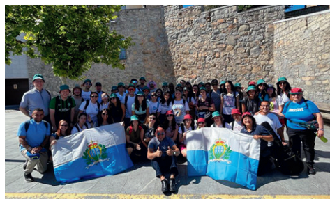
Il gruppo di San Marino

Siamo tornati consapevoli che «calcolare» l'amore, la consolazione e i doni ricevuti non è possibile. E lo abbiamo sperimentato con la «mai tipica» emozione di chi torna da un cammino senza più certezze perché tutto è cambiato. Frasi strappalacrime poi, quelle dei due «condottieri» del nostro pullman: «Siamo partiti autisti, siamo tornati amici». Lo senti? Ancora il rumore di Lisbona ti assorda. Porgi l'orecchio: non è finita qua.