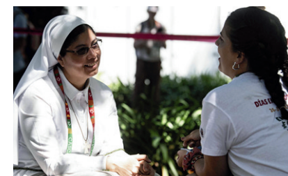
La Città della Gioia alla Gmg di Lisbona

di Cristo - racconta don Orazio - Papa Francesco ci ha invitati a non aver paura di fermarci a pregare perché è dall'incontro con Dio che i giovani devono ripartire con entusiasmo. La Gmg è stato un bellissimo evento che non può terminare con i giorni di Lisbona». I pellegrini hanno voluto omaggiare, con una Corona del Rosario che riporta il logo della Gmg, il vescovo Raspanti che si è rivolto ai suoi ragazzi con parole di speranza e fiducia: «La Gmg è un raduno importante nel quale i giovani rafforzano la propria fede ed è occasione per scoprirsi non eccezione della società, ma fratelli di tutto il mondo. Mostra che non siamo soli nella fede ed infatti si prega in comunione con il mondo del quale tutti facciamo parte. Chissà dove sarete tra dieci anni? Forse - ha proseguito il vescovo parlando ai ragazzi - qualcuno di voi sarà sposato o si troverà all'estero. Non importa: siete cristiani, siete di Dio e lui non vi abbandonerà mai». (Sir)