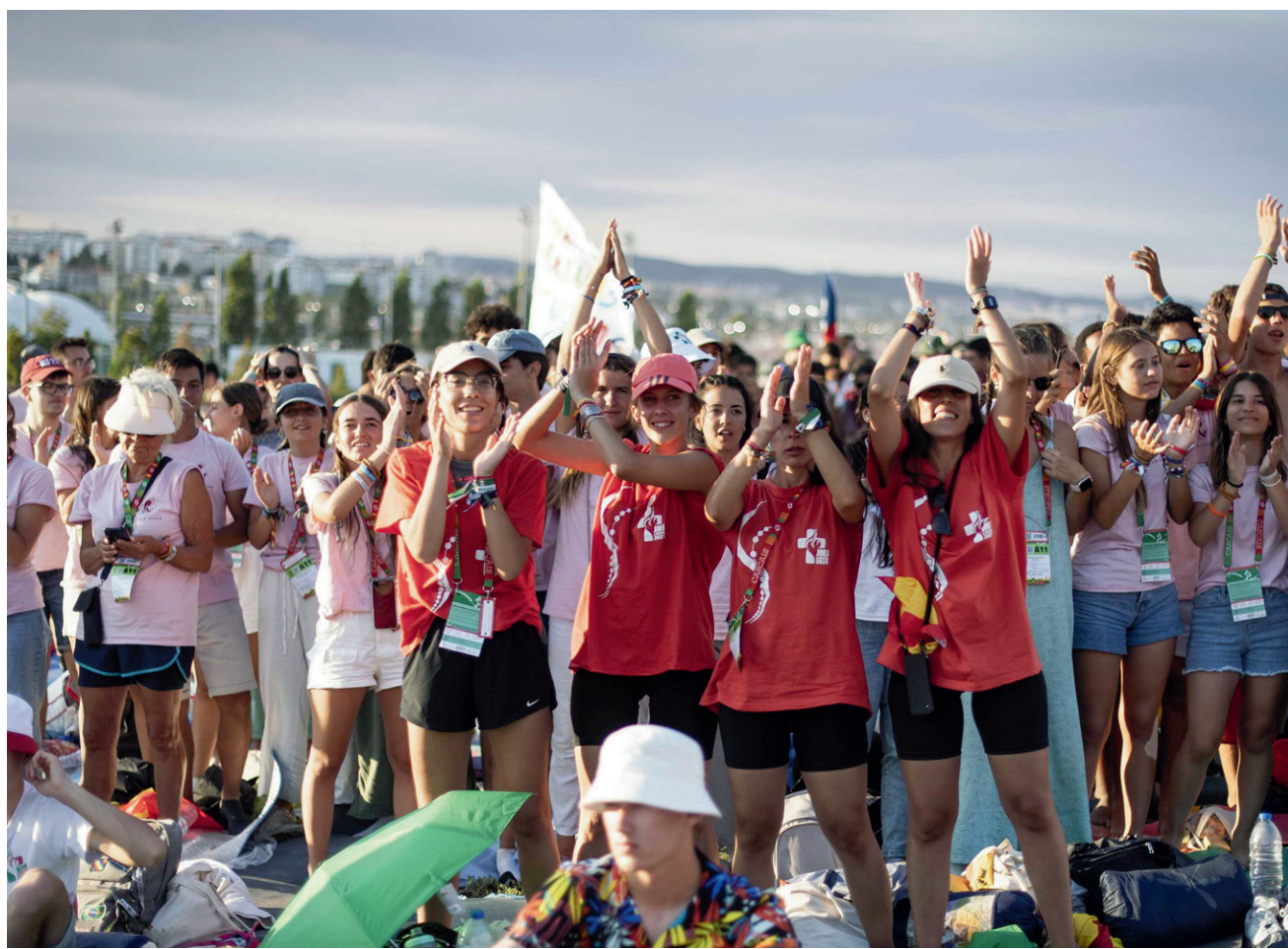
Al Campo della Grazia si sono tenuti veglia e Messa finale della Gmg di Lisbona