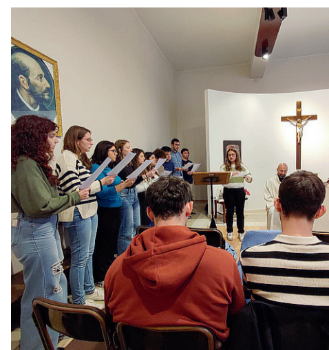
Un momento del Triduo. Tanti i gesti che i giovani catanesi hanno scelto di vivere insieme: dai canti, alle letture, alla Via Crucis con gli adulti della diocesi / Tancredi Bella

varie forme. Ci unisce, certo, l'obiettivo della laurea, ma ancor di più il desiderio di crescere nella fede, in ciò che di bello abbiamo incontrato, per poterlo portare negli ambienti che ogni giorno frequentiamo. Venerdì mattina un altro momento di meditazione insieme. Poi noi universitari di Cl di Catania ci siamo uniti alla Via Crucis con gli adulti al Santuario della Madonna della Rocca di Belpasso. Al termine di tutti questi gesti così significativi, Riccardo, referente del Clu di Catania, traccia un suo personale bilancio: «I canti, le letture di Péguy, la Via Crucis: tutto è stato utile a capire che Cristo è salito in croce anche per le mie miserie, per abbracciare me personalmente. Allora mi accorgo che è Lui che mi salva».